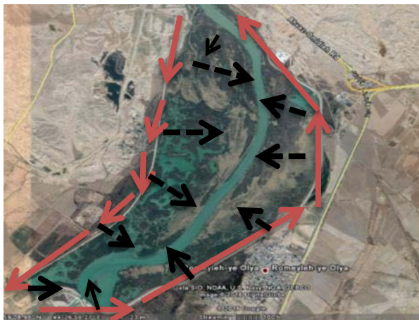
شکل ۱: موقعیت سد شهدای رامشیر، مسیر حرکت بر روی خاکریز و شمارش پرندگان منبع (Google Earth)

روش شمارش پرندگان: ابتدا با استفاده از Google Map موقعیت و مکان تالاب بر روی نقشه مشخص شد. سپس از بهمن تا خردادماه به مدت ۶ ماه به‌طور ماهانه بین ۱۲ تا ۱۵ هرماه، با پیمایش بر روی خاکریزهای محاط کننده تالاب در طول یک روز از ساعت ۷ صبح تا ۱۲ ظهر، پرندگان مشاهده و شمارش شدند. شکل ۱ موقعیت سد شهدای رامشیر و مسیر حرکت و شمارش پرندگان را نشان می‌دهد. شمارش با روش Total Count با دوربین چشمی ۴۰×۱۰ و تلسکوپ ۶۰×۱۵ زایس آلمان انجام شد. این روش شمارش پرندگان آبی استاندارد جهانی است و موسسه بین‌المللی Wetland International آن را توصیه و هر ساله تمام پرندگان آبی تالاب‌های جهانی در بهمن‌ماه با همین روش در کشورهای جهان شمارش و نتایج آن به دفتر این موسسه برای تجزیه و تحلیل ارسال می‌شود. در ایران نیز از سال ۱۳۴۸ پرندگان آبی تالاب‌ها توسط سازمان حفاظت محیط زیست با این روش شمارش می‌شود. به همین دلیل شمارش پرندگان تالاب شهدای سد رامشیر نیز به با همین روش انجام شد. بین ۱۲ تا