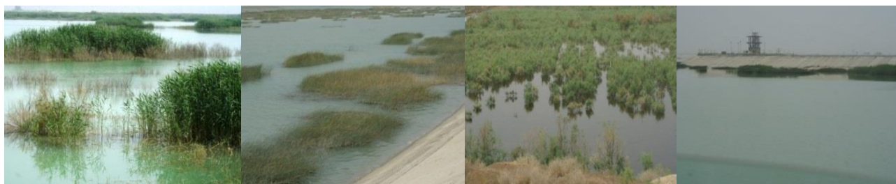
شکل ۲: سیمای طبیعی تالاب پشت سد شهدای رامشیر (عکس: بهروزی‌راد، فروردین ۱۳۹۴)