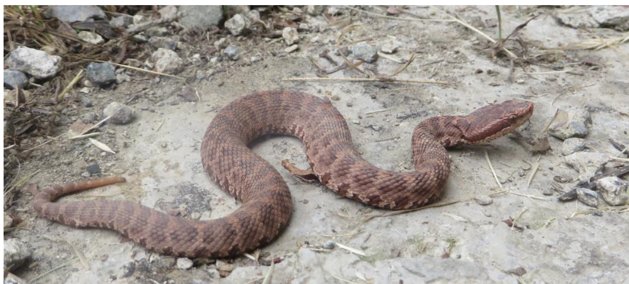
شکل ۲: افعی قفقازی Gloydius halys caucasicus متعلق به استان گلستان (کردکوی - روستای ایلوار)

تشخیص جنسیت با توجه به وجود یا عدم وجود همی‌پنیس در نرها و عدم وجود آن در ماده‌ها انجام شد و هم‌چنین برخی نمونه‌ها تشریح گردید تا با توجه به وجود بیضه یا تخمدان جنسیت آن‌ها مشخص شود. طول پوزه تا مخرج (SVL) از قسمت جلویی نوک پوزه