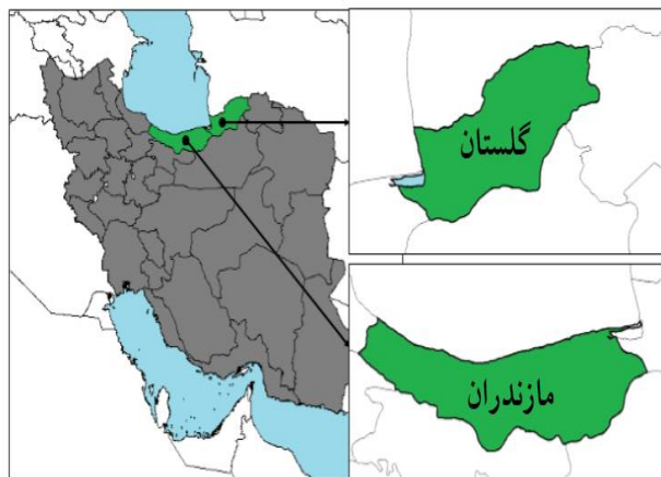
شکل ۱: موقعیت استان گلستان و مازندران در ایران

تعداد ۵۴ نمونه افعی قفقازی (۲۰ نر، ۲۱ ماده، ۱۱ نابالغ و ۲ نامشخص) از موزه جانورشناسی دانشگاه گلستان (ZMGU) و کلکسیون‌های شخصی که از استان‌های گلستان و مازندران در طی سال‌های ۱۳۷۲ تا ۱۳۹۴ جمع‌آوری شده بود، مورد مطالعه قرار گرفت. استان گلستان در محدوده جغرافیایی ۵۴ درجه تا ۵۶ درجه طول شرقی و ۳۶ درجه و ۳۰ دقیقه تا ۳۸ درجه و ۱۵ دقیقه عرض شمالی و استان مازندران در ۳۵ درجه و ۴۷ دقیقه تا ۳۶ درجه و ۳۵ دقیقه عرض شمالی و ۵۰ درجه و ۳۴ دقیقه تا ۵۴ درجه و ۱۰ دقیقه طول شرقی از نصف النهار مبداء واقع شده است. استان گلستان از شمال با جمهوری ترکمنستان، از جنوب با استان سمنان، از غرب با استان مازندران و از شرق با استان خراسان شمالی همسایه است و استان مازندران، از شمال به دریای مازندران، از جنوب به استان تهران، قزوین و سمنان، از غرب به استان گیلان و از شرق به استان گلستان محدود می‌شود (شکل ۱).