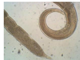
شکل 3: انگل رابدوکونا دنوداتا (عدسی 10x) (عکس از نگارنده)

زرین گل و شیرآباد به تفکیک گروه‌های سنی نشان داد که نمونه‌های نهر زرین گل در تمامی گروه‌های سنی از نظر طول کل و وزن نسبت به نمونه‌های نهر کبودوال و شیرآباد دارای مقادیر کمتری بودند اما نمونه‌های نهر کبودوال و شیرآباد از این لحاظ تقریباً به هم نزدیک بودند (جدول 1).