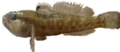
شکل 2: گاوماهی شنی (گاوماهی میمون) ( Neogobius Pallasii Berg, 1916)

در تحقیق حاضر، گونه انگل نماتد (Dujardin, 1845) Rhabdochona denudata در ایران برای اولین بار در گونه گاوماهی شنی گزارش گردید (شکل 2 و 3).