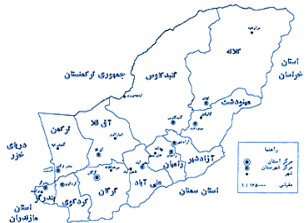
شکل ۱: نقشه موقعیت محدوده مورد مطالعه در استان گلستان

آبزی مانند رودخانه‌ها، آب‌بندان‌ها، استخرهای پرورش ماهی استان گلستان نمونه‌برداری انجام شده است. در جدول ۱ مختصات جغرافیایی مربوط به هریک از ایستگاه‌های نمونه‌برداری گزارش شده است. جمع‌آوری نمونه‌ها در فصول تابستان، پاییز و زمستان سال ۱۳۹۵ و بهار سال ۱۳۹۶ انجام و ابزار مورد استفاده در این مطالعه، شامل دوربین دیجیتال، تور، سطل برای جمع‌آوری نمونه‌ها بود و ۲۵ صفت مورفومتریک به‌وسیله کولیس دیجیتال با دقت ۰/۰۱ میلی‌متر مورد بررسی و اندازه‌گیری قرار گرفت.