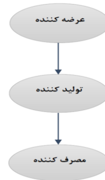
شکل ۱: مدل مفهومی پژوهش